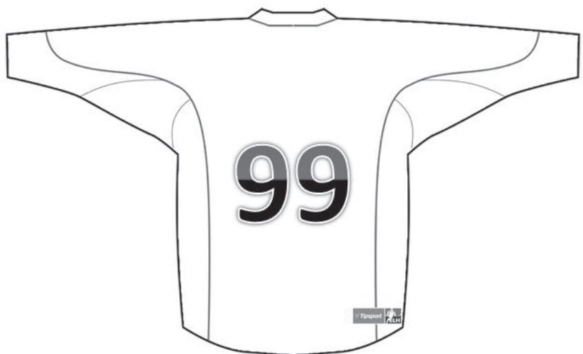
Náhled umístění loga Tipsport ELH na zadní straně dresu

5.9. Kluby jsou pro účely utkání Tipsport ELH povinny umístit na pravou spodní část zadní strany dresu logo Tipsport ELH o velikosti 10x3,5 cm.